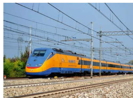
2 I treni e sistemi diagnostici costruiti dalla Mermec sono utilizzati sulle linee ferroviarie di sessanta paesi, Italia compresa.